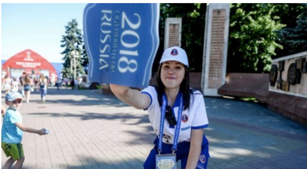
Eine der über 30.000 City Volunteers: Jugendliche Freiwillige, die sich 2 Jahre wöchentlich auf ihren Einsatz vorbereiteten - ohne Bezahlung - ausländische Fans an den Flughäfen und Bahnhöfen in Empfang zu nehmen,

Eine deutsche Fußballfan-Gruppe , die schon " Unsere WM 2014 " als Buch herausgab, beschreibt auch aus Russland zur WM 2018 ihre Erfahrungen als stimmungsvollen Erlebnis- und Reisebericht. Ein WM-Tagebuch, das detailliert, ausführlich und hautnah emotionale und begeisternde Begegnungen mit Russland und seinen Menschen näherbringt .