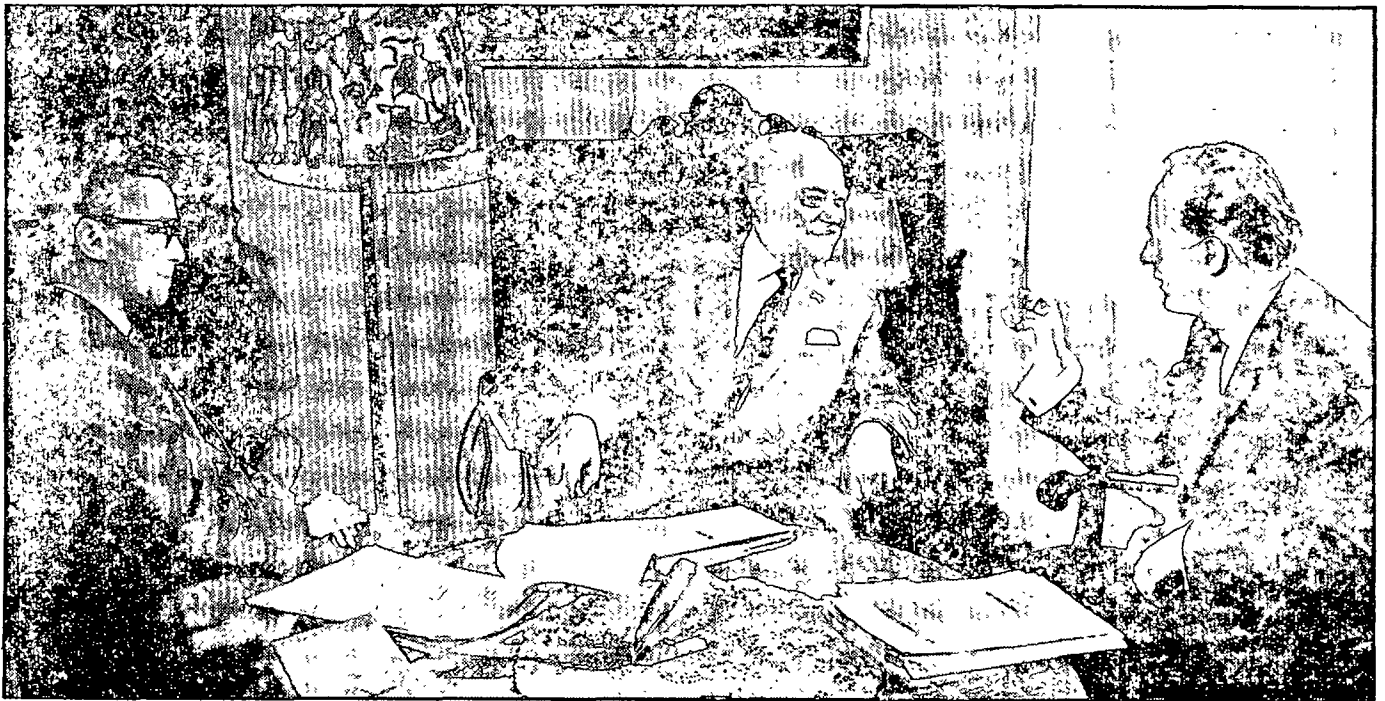
Pabst (M.) beim SPIEGEL-Gespräch in seiner Düsseldorfer Wohnung*

PABST: ... den Sie mir da vorsetzen. Die Sache war so: Wir waren die Macht im Staate und nicht die Volksbeauftragten. Diese sind gekommen am 24. Dezember (1918) und haben uns gebeten, herausgepackt zu werden aus den Klauen der revolutionären Kräfte in