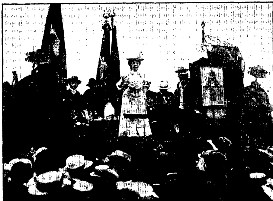
... Kolbenhiebe auf den Kopf: Pabst-Opfer Rosa Luxemburg (1912)

PABST: Das Transportkommando Liebknacht meldete — jetzt kommen wir der Sache wieder näher —, daß Herr Liebknacht beim Fluchtversuch im Tiergarten erschossen worden wäre. Und das Transportkommando Luxemburg meldete, daß Rosa Luxemburg von einem unbekanntem Mann, der auf das Trittbrett des Autos gesprungen ist in der Nähe des Landwehrkanals, erschossen worden wäre, nachdem sie vorher von einem Posten diesen Kolbenschlag bekommen hat und besinnungslos ge-