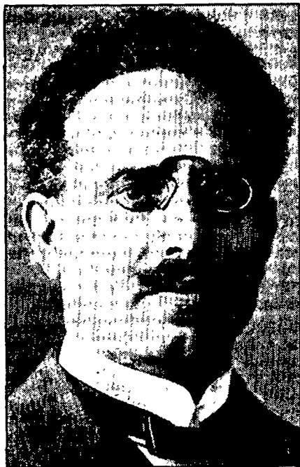
Pabst-Opfer Liebknacht (1918) Vom Husaren vor der Tür ...

SPIEGEL: Haben Sie befohlen, daß die beiden — sagen wir — getötet werden sollen?